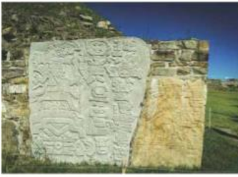
La Estela 1 de la Plataforma Sur en Monte Albán que representa al gobernante 12 Jaguar sentado en su trono.