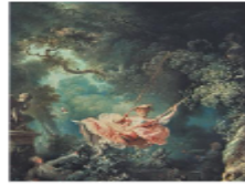
• El Columpio , de Jean-Honoré Fragonard (1766), es considerada una obra maestra del rococó.

Como viste en secuencias anteriores, el arte barroco surgió en Europa durante el siglo XVII y parte del XVIII. Sirvió como instrumento para difundir la fe católica ante la expansión del protestantismo. Tenía una tendencia a la escenificación y el espectáculo, a la saturación de los espacios con formas irregulares y curvilíneas. El barroco predominó en las cortes absolutistas europeas y llegó a ser un estilo internacional con marcadas diferencias regionales; por ejemplo, en los países protestantes, como los reinos alemanes y los Países Bajos, el barroco tuvo características muy distintas a las de Francia, Italia o España. En el siglo XVIII surgió en Francia el estilo rococó, difundido por Europa en la época de Luis XV. El rococó se caracterizó por su luminosidad y refinamiento. Retrató la vida cortesana de la aristocracia y también la vida lujosa de la alta burguesía. Reflejaba el esplendor de las cortes, en particular la francesa.