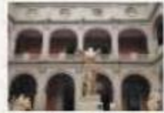
En la actualidad, el edificio de la Academia de San Carlos pertenece a la Facultad de Artes y Diseño de la UNAM.

De acuerdo con Humboldt, ¿cómo son los estudiantes de la Academia?