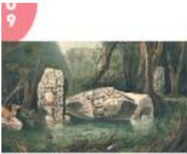
Frederick Catberwood, Copán, 1837. Parte de su colección de ruinas mayas.

La guerra de Independencia disminuyó los recursos económicos de la Academia de San Carlos hasta que tuvo que cerrar de 1820 a 1821. Durante las primeras décadas del México independiente la Academia careció de los recursos suficientes para su adecuada operación. Durante este periodo llegaron a México diversos artistas extranjeros que se interesaron por dibujar y pintar las costumbres, los paisajes y los tipos de personas que habitaban en el país.