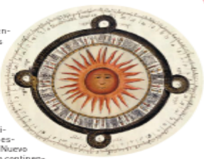
Ilustración que describe el calendario azteca o Piedra del Sol en el libro de Antonio de León y Gama de 1792: Descripción histórica y cronológica de los dos pedruzcos que con ocasión del nuevo empedrado que se está formando en la plaza principal de México, se hallaron en ella el año de 1792.

EL INICIO DE LA LUCHA POR LA INDEPENDENCIA 173