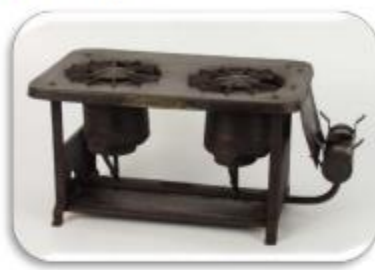
Estufa de gas

¿Cuáles fueron los productos que innovaron la vida cotidiana de las personas durante el siglo XX?