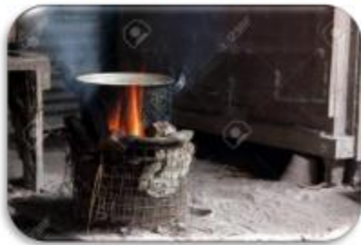
Cocinar con carbón

Instrucciones. Recuerda que antes la manera de cocinar era distinta, primero se acostumbraba cocinar con carbón, luego gracias a las innovaciones en los productos se logró cocinar con estufa de gas, esto durante el siglo XX. En el siguiente cuadro identifica cuales fueron los productos que innovaron la vida cotidiana de las personas durante el siglo XX. Pag, 211.