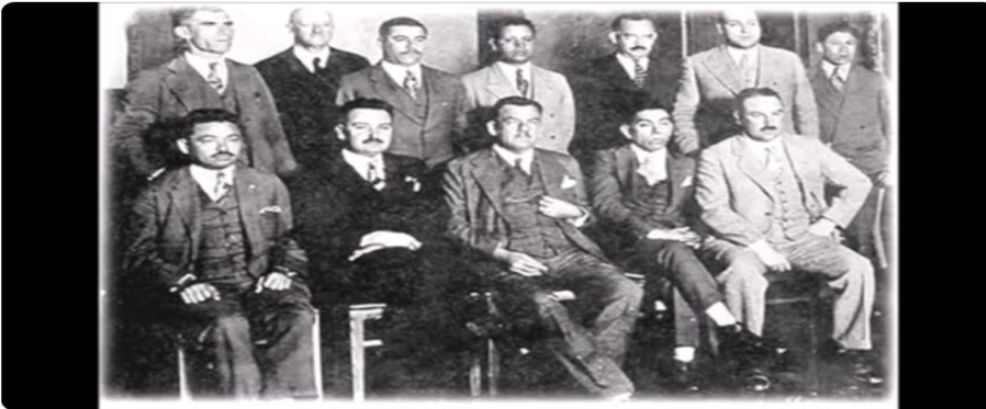
La política revolucionaria y nacionalista.

https://www.youtube.com/watch?v=CCj9vhSKFWI