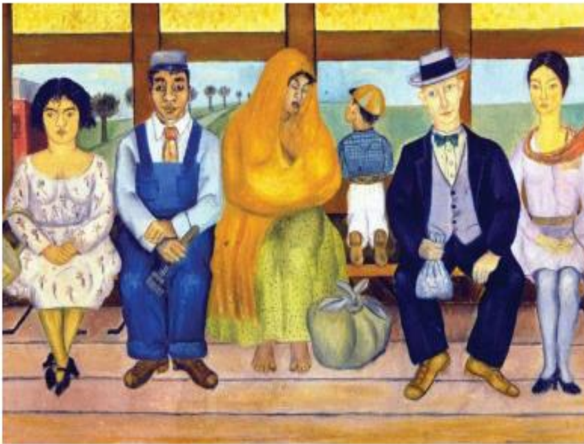
FRIDA KAHLO, EL CAMION, 1929.

Instrucciones. Observa la imagen y responde las siguientes preguntas.