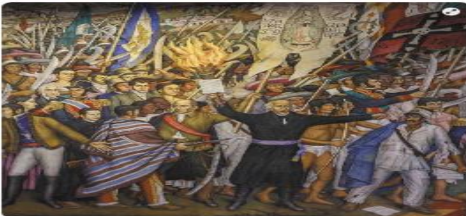
La guerra de Independencia de México fue un proceso histórico que tuvo consecuencias en todos los ámbitos de la vida de los mexicanos

A lo largo de esta secuencia se han mencionado dos palabras relevantes: hechos y procesos. ¿Cuál es la diferencia entre ellos? Un hecho es un acontecimiento que tiene tal impacto en la vida de las personas, ya sea de forma individual o colectiva, que adquiere un lugar importante en la memoria social. Algunos hechos históricos pueden estar relacionados con el quehacer de hombres y mujeres; por ejemplo, la inauguración de los Juegos Olímpicos de 1968 en Ciudad Universitaria, en la capital del país. Pero otros podrían tener una causa natural; un ejemplo es el terremoto del 19 de septiembre de 1985 que afectó a numerosas personas y provocó el colapso de edificios e infraestructura en la Ciudad de México y otras ciudades.