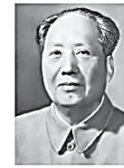
Mao: líder Rev. China (1949)