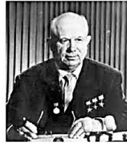
Nikita Jrushov, inició la desestalinización