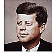
Kennedy, preside USA cuando los "misiles de Cuba"

TRABAJO TRIMESTRAL: Elaborar un noticiero con personajes históricos. El trabajo es en equipo.