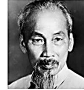
Ho Chi Minh Líder norvietnamita