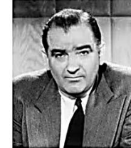
MacCarthy: responsable de la "caza de brujas" de izquierdistas en EEUU