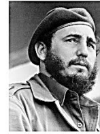
Fidel Castro, líder cubano.