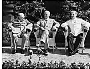
Conferencia de Paz de Potsdam: Churchill, Truman y Stalin dividen el mundo en zonas de influencia.