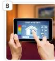
fossil fuel gadget