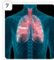
fresh air lungs