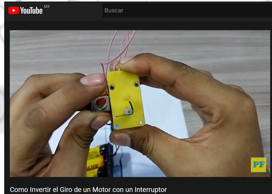
Como Invertir el Giro de un Motor con un Interruptor